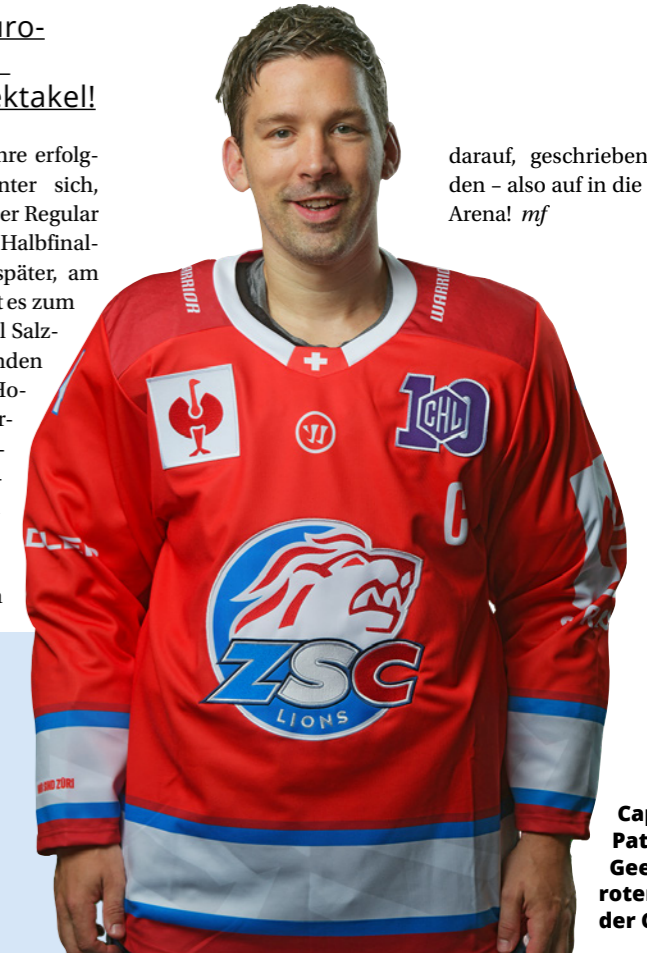
darauf, geschrieben zu werden – also auf in die Swiss Life Arena! mf

Die Bayern haben ihre erfolgreichste Saison hinter sich, mit dem 3. Platz in der Regular Season und dem Halbfinaleinzug. Zwei Tage später, am 15. September, kommt es zum Duell gegen Red Bull Salzburg, dem amtierenden Meister der ICE Hockey League in Österreich. Die CHL-Spiele in Zürich versprechen Spannung und Abwechslung zum Liga-Alltag. Neue Geschichten warten