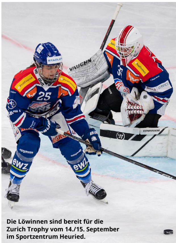
Die Löwinnen sind bereit für die Zurich Trophy vom 14./15. September im Sportzentrum Heuried.

Am 14. und 15. September wird im Sportzentrum Heuried die 5. Zurich Trophy ausgetragen, ein internationales Frauen-Eishockeyturnier. Fünf europäische Topteams, darunter die ZSC Lions Frauen, treten in einem spannenden Wettbewerb mit attraktivem Spielmodus und kurzen Spielzeiten gegeneinander an. Doch die Zurich Trophy ist mehr als nur ein Turnier: Für Besucherinnen und Besucher jeden Alters gibt es zahlreiche Attraktionen und Gewinnspiele rund um den Event. co